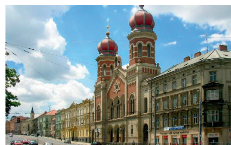
▲ Große Synagoge in Pilsen