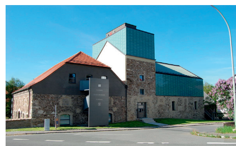
▲ Centrum Bavaria Bohemia